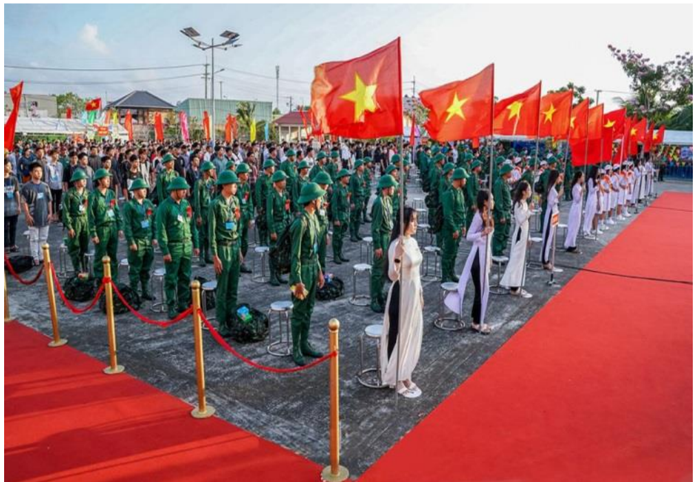
Thanh niên huyện Năm Căn sẵn sàng lên đường bảo vệ Tổ quốc

hành chặt chẽ, nghiêm túc, với nhiều chủ trương, biện pháp, phù hợp đặc điểm, tình hình thực tế của địa phương. Phát huy vai trò tham mưu nòng cốt của Cơ quan Quân sự và Hội đồng NVQS các cấp; đồng thời, thường xuyên làm tốt công tác chính sách hậu phương quân đội, với phương châm “Làm tốt chính sách hậu phương Quân đội là cánh tay nối dài góp phần nâng cao chất lượng tuyển quân”, đồng thời thành lập nhiều