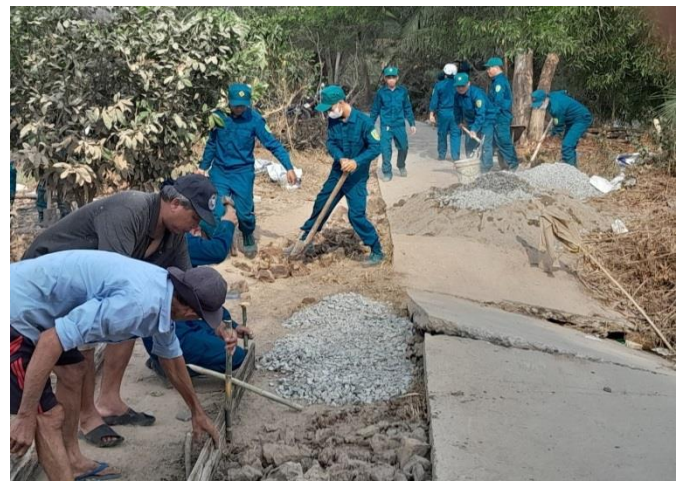
Lực lượng dân quân cùng Nhân dân địa phương tham gia vá lộ giao thông nông thôn tuyến lộ Lung Ranh thuộc địa bàn xã Khánh Tiến, huyện U Minh

Có thể khẳng định rằng, việc triển khai thực hiện kết hợp huấn luyện lực lượng DQTV với công tác vận động quần chúng trên địa bàn huyện đã góp phần nâng cao hiệu quả công tác dân vận của Đảng trong tình hình mới, tuyên truyền đường lối, chủ trương của Đảng, chính sách, pháp luật của Nhà nước đối với Nhân dân; thực hiện tốt chức năng đội quân công tác của Quân đội, góp phần xây dựng “thế trận lòng dân”, mối quan hệ đoàn kết, gắn bó với cấp ủy, chính quyền và Nhân dân địa phương, xây dựng hệ thống chính trị vững mạnh; rèn luyện phương pháp, tác phong công tác cho cán bộ, chiến sĩ DQTV. Đồng thời, góp phần thực hiện có hiệu quả phong trào thi đua “dân vận khéo”, xây dựng “đơn vị dân vận tốt”; phong trào thi đua “LLVT huyện chung sức xây dựng nông thôn mới” trên địa bàn huyện.