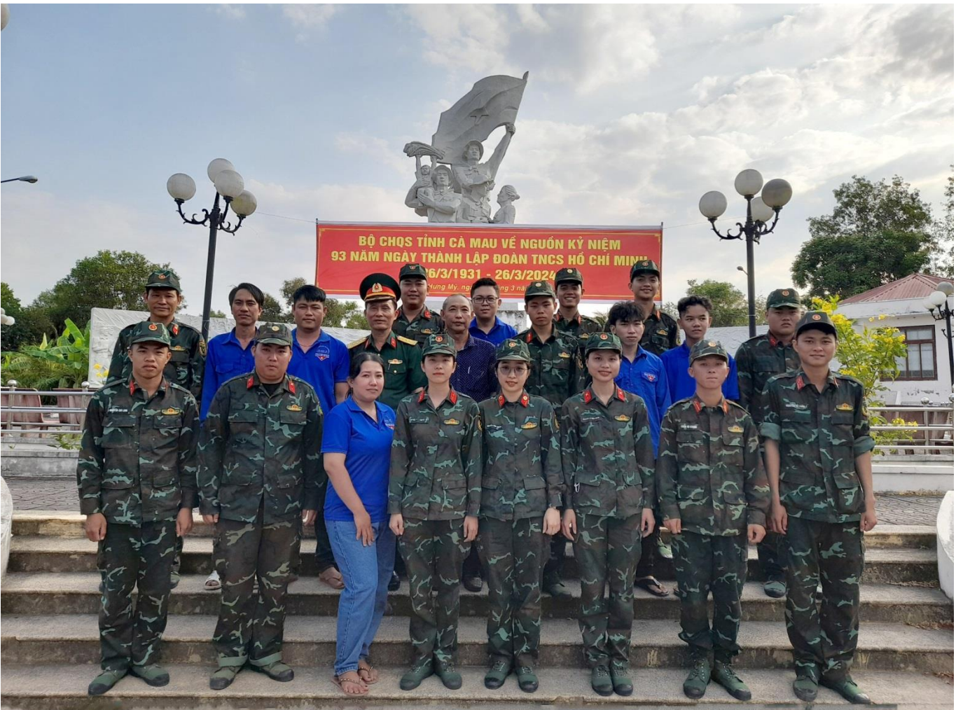
Đoàn Thanh niên, Hội Phụ nữ Bộ CHQS tỉnh Cà Mau tổ chức về nguồn kỷ niệm 93 năm ngày thành lập Đoàn TNCS Hồ Chí Minh tại Khu Căn cứ Tỉnh đội