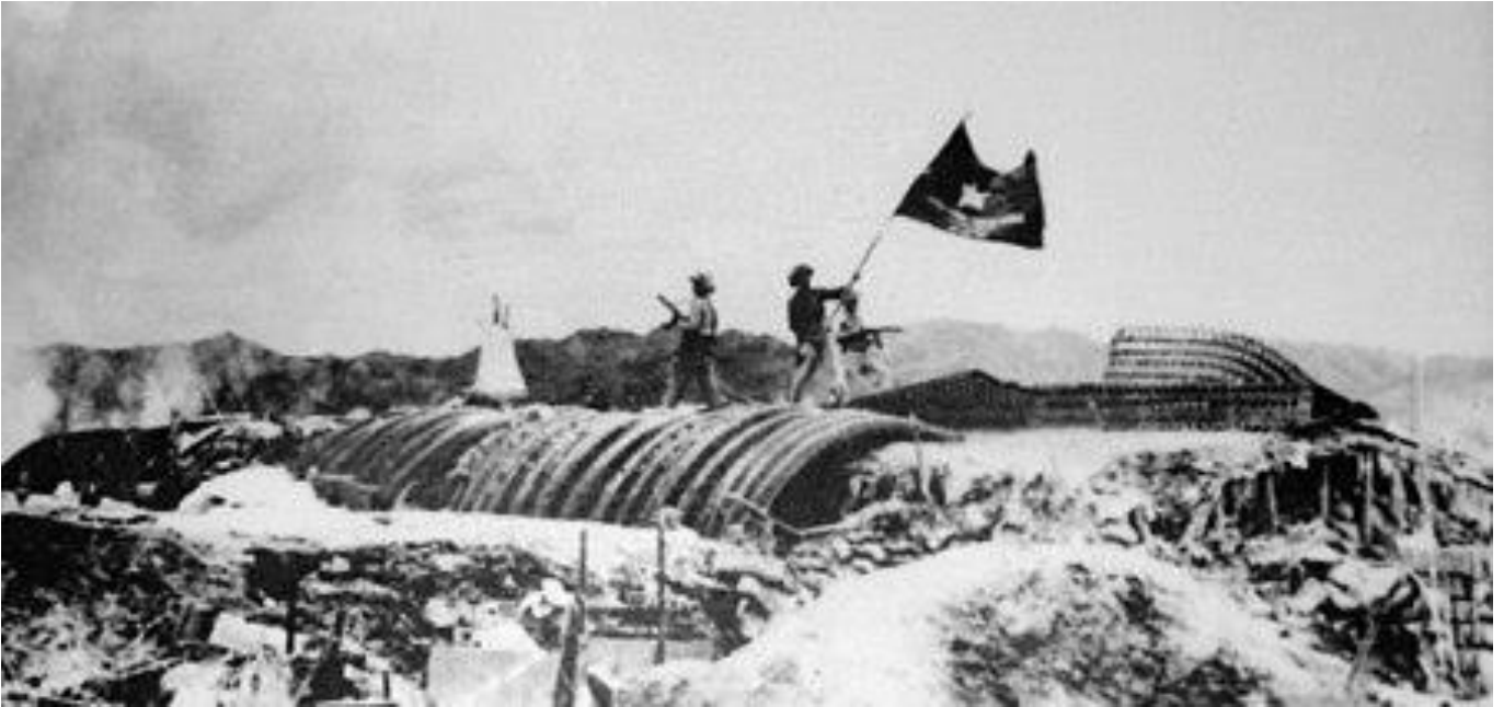
Quân đội Nhân dân Việt Nam phát cờ chiến thắng trên nóc trung tâm phòng ngự của Tập đoàn cứ điểm Điện Biên Phủ (Ảnh trích từ tác phẩm của đạo diễn Roman Karmen)

mạng Việt Nam; đồng thời là một sự kiện quan trọng báo hiệu sự sụp đổ hoàn toàn của chủ nghĩa thực dân cũ trên phạm vi toàn thế giới. Chiến dịch lịch sử Điện Biên Phủ toàn thắng, đây là bản anh hùng ca của cuộc chiến tranh nhân dân thần kỳ, “ được ghi vào lịch sử dân tộc như một Bạch Đằng, một Chi Lăng hay một Đống Đa trong thế kỷ XX, và đi vào lịch sử thế giới như một chiến công chói lọi đột phá thành trì của hệ thống nô dịch thuộc địa của chủ nghĩa đế quốc ”.