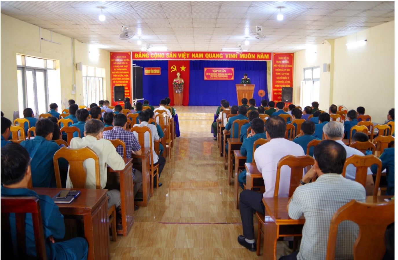
Quang cảnh lớp tập huấn cán bộ Phó Chỉ huy trưởng Ban CHQS cấp xã và cơ quan tổ chức năm 2024