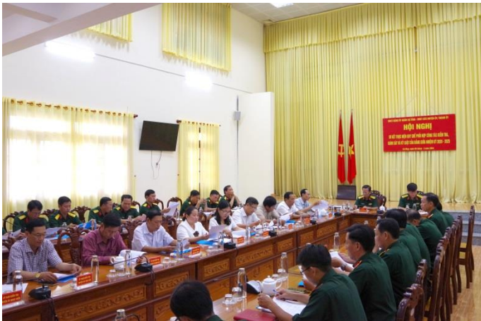
Hội nghị sơ kết thực hiện quy chế phối hợp công tác kiểm tra, giám sát và kỷ luật của Đảng giữa nhiệm kỳ 2020 - 2025