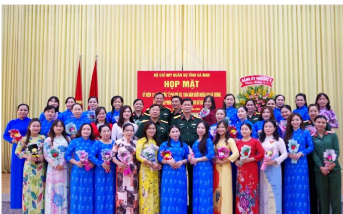
Quý thủ trường cùng các chị em là SQ, QNCN, LDHD chụp ảnh lưu niệm nhân dịp họp mặt 8/3