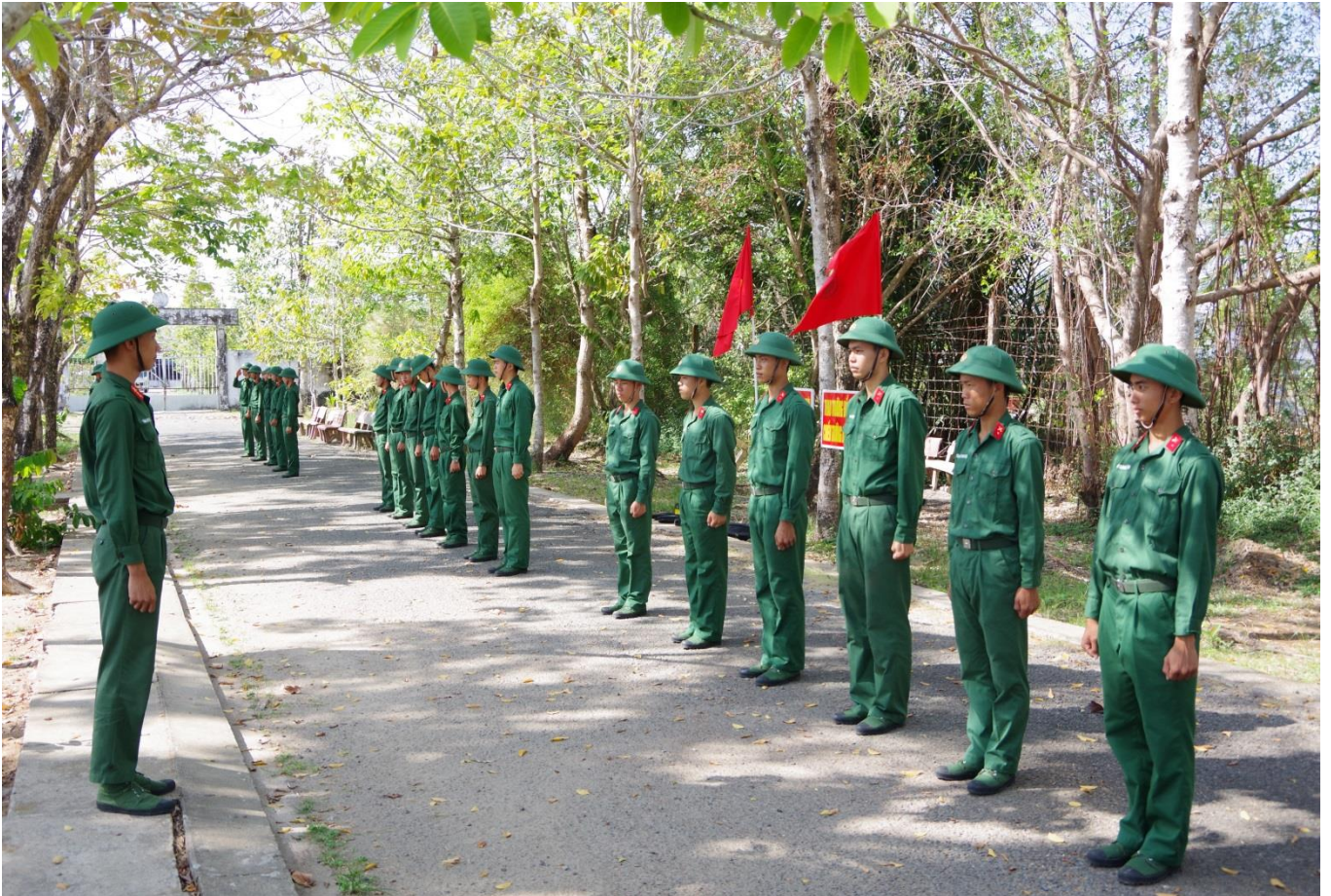
Chiến sĩ mới luyện tập điều lệnh đội ngũ

BB896 vẫn được thực hiện đúng theo kế hoạch; với khí thế của tuổi trẻ, các chiến sĩ mới luôn thể hiện quyết tâm cao nhất, hăng say tập luyện, tích cực nắm bắt từng động tác, kiên trì rèn luyện kỹ năng... Bên cạnh đó, cán bộ các cấp luôn tận tình hướng dẫn, uốn nắn, chỉnh sửa từng động tác cho chiến sĩ; sau mỗi buổi huấn luyện đơn vị duy trì thực hiện nghiêm túc việc kiểm tra, hội thao đánh giá kết quả nhận thức của chiến sĩ, cách làm này đã giúp cho đơn vị nắm chắc khả năng hiểu biết của từng chiến sĩ, từ đó đề ra biện pháp, phân công cán bộ hướng dẫn, giúp đỡ những chiến sĩ còn hạn chế, qua đó đã góp phần nâng cao chất lượng huấn luyện của đơn vị.