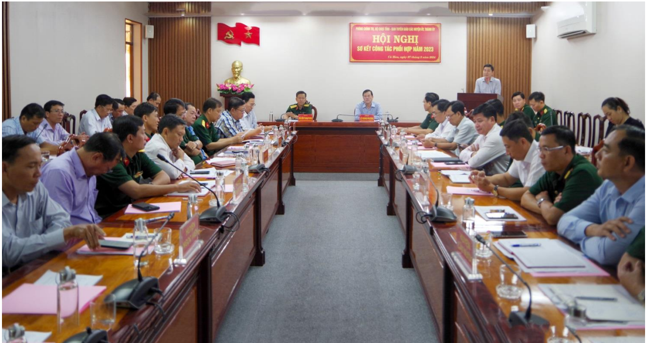
Sơ kết công tác phối hợp giữa Phòng Chính trị, Bộ CHQS tỉnh với Ban Tuyên giáo các Huyện ủy, Thành ủy năm 2023

Thực hiện Quy chế phối hợp, những năm qua, hoạt động phối hợp giữa Phòng Chính trị, Bộ CHQS tỉnh Cà Mau với Ban Tuyên giáo các Huyện ủy, Thành ủy về công tác tuyên huấn, tuyên giáo trên địa bàn tỉnh đã đạt được nhiều kết quả nổi bật.