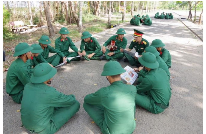
Phút giải lao trên thao trường của chiến sĩ mới

Với đặc điểm khi mới tiếp xúc với môi trường quân đội, hầu hết các chiến sĩ mới đều có chung tâm lý bỡ ngỡ, cùng với đó là nhớ nhà, người thân, bạn bè... đã tác động không nhỏ đến tâm trạng, tư tưởng, tình cảm. Để chiến sĩ mới nhanh chóng hòa nhập với môi trường quân đội và bắt nhịp với các hoạt động của đơn vị, ngay từ những ngày đầu, tháng đầu trong quân ngũ, cán bộ từ cấp trung đội, đại đội, tiểu đoàn đến chỉ huy Trung đoàn chủ động kiểm tra, thăm hỏi, động viên, nắm bắt tâm tư, tình cảm của chiến sĩ. Cán bộ từng bước hướng dẫn chiến sĩ thực hiện các chế độ trong ngày, trong tuần; tổ chức các buổi sinh hoạt tâm sự đồng đội, tạo không khí vui tươi, phấn khởi cho chiến sĩ. Các phân đội tích cực tổ chức các buổi huấn luyện ngoại khóa, làm tốt công tác giáo dục chính trị tư tưởng, kịp thời nắm chắc chất lượng chiến sĩ mới thông qua phiếu “Thông tin chiến sĩ” và gia đình, người thân, bạn bè; rà soát những đồng chí có hoàn cảnh khó khăn, chủ động phối hợp với địa phương, gia đình tạo điều kiện giúp đỡ để chiến sĩ an tâm thực hiện nhiệm vụ.