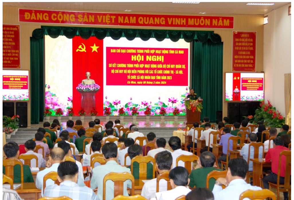
Quang cảnh hội nghị Sơ kết chương trình phối hợp hoạt động giữa Bộ Chỉ huy Quân sự, Bộ Chỉ huy Bộ đội Biên phòng với các tổ chức chính trị - xã hội, tổ chức xã hội nhân đạo tỉnh Cà Mau năm 2023

Bên cạnh đó, còn phối hợp với các cấp ủy, chính quyền địa phương các cấp giúp nhân dân thu hoạch hoa màu bị ngập úng do triều cường dâng