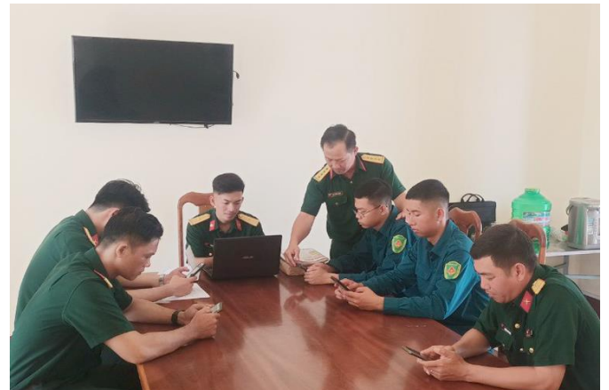
Lực lượng 47 của LLVT huyện tiến hành đăng tải, chia sẻ và tương tác tin, bài trên không gian mạng

Xác định việc nâng cao chất lượng, hiệu quả hoạt động của Lực lượng 47 là nhiệm vụ trọng tâm, là mặt trận chính trong đấu tranh bảo vệ nền tảng tư tưởng của Đảng. Những năm qua Đảng ủy, Ban CHQS huyện luôn bám sát các văn bản chỉ đạo, định hướng của trên, rà soát toàn bộ tài khoản mạng xã hội của cán bộ, đảng viên, nhân viên, chiến sỹ, lực lượng dân quân tự vệ (DQTV); tổ chức cho cán bộ, chiến sỹ đăng ký tham gia các trang, nhóm đấu tranh của LLVT tỉnh, huyện trên không gian mạng như: nhóm “CHANG ĐUỐC”, “HƯƠNG BIỂN”, “HẢI YẾN”, “BIỂN TÂY”... Bên cạnh đó xây dựng những hạt nhân nòng cốt trong việc đấu tranh phản bác các quan điểm sai