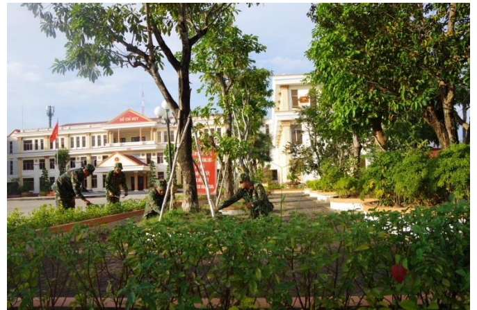
Cán bộ, chiến sĩ LLVT tỉnh xây dựng cảnh quan đơn vị xanh – sạch – đẹp

chấn chỉnh những quân nhân chấp hành không nghiêm, tạo sự chuyển biến tích cực, thống nhất trong cơ quan, đơn vị; củng cố, xây dựng, hoàn chỉnh toàn bộ hệ thống biển, bảng chính quy theo đúng quy định của Bộ Tổng tham mưu.